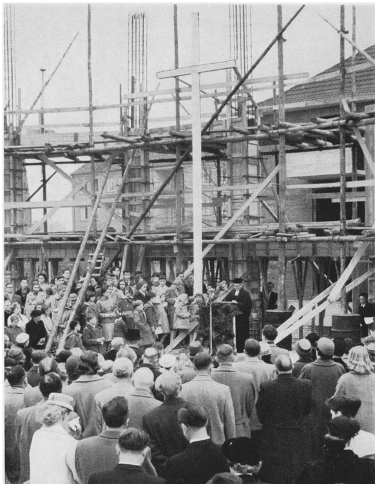
Grundsteinlegung der Tersteegenkirche am 24. März 1957